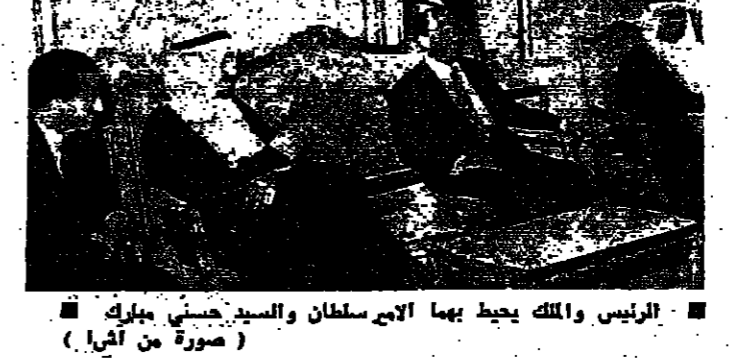
الرئيس والملك يحيط بهما الامير سلطان والسيد حسني مبارك

وصل الملك خالد بن عبد العزيز والسادات السعوديين الى القاهرة والاسكندرية بقطار امسي، وجررت لهم استقبالات شعبية حاشدة في المحطات التي مر بها القطار.